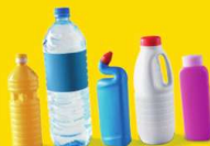
BOUTEILLES ET FLAONS EN PLASTIQUE